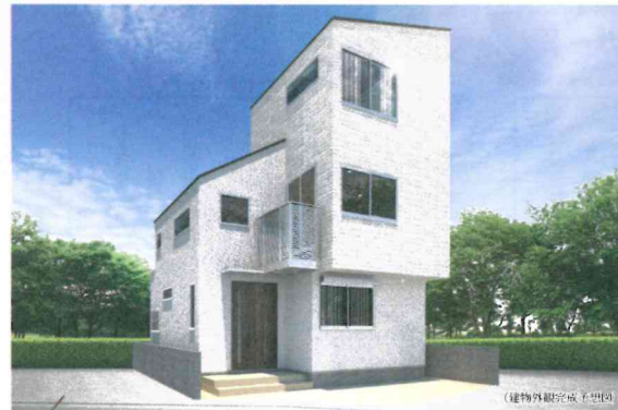
シンプルさの中にも気品が漂う白を基調とした外観